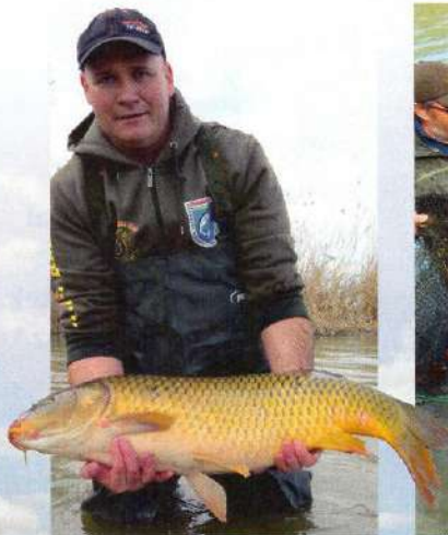
A nagyponty-védelmi program 2019-ben elindult, s bízunk benne, hogy még hosszú évtizedeken keresztül szolgálja a ráckevei pontyokat és horgászokat