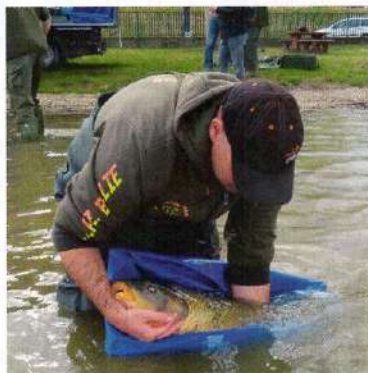
A halak a szállítást követően kíméletesen és gyorsan kerültek a vízbe, és lelteik ezáltal az RSD-n „új hazára”

A Ráckevei Dunaági Horgász Szövetség a későbbiekben, lehetőségeihez mérten, még tervez kapitális méretű pontytelepítéseket. Továbbá szervezik a hivatásos halőrök közreműködésével a haljelölés kiterjesztését – halfajtól függetlenül – valamennyi megfogott és bejelentett rekordhal esetében is. Biztos vagyok benne, hogy a már napjainkban is legendás RSD pontyok ennek a programnak köszönhetően tovább öregbítik hírüket, sok örömet okoznak még az idelátogató horgászoknak.