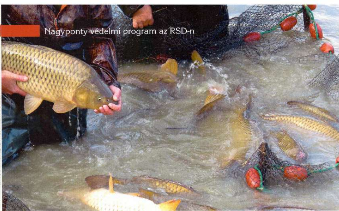
Az anyapontyok a vízbe helyezés után tovább erősítik a ráckevei pontyok jó hírét

része mára meghaladja a tíz kilón felüli egyedenkénti testtömeget.