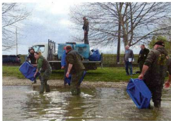
50 darab nagyméretű, tíz kilón felüli pontyot telepítettek a vízbe Szigetbecse és Szigetcsép környékén

Az RSD kiemelkedő nagypontyállománnyal rendelkezik, és a horgászok körében is egyre népszerűbb a nagy pontyok célzott horgászata. A horgászvíz halgazdálkodási értékének növelése és a nagy pontyokra horgászók támogatása érdekében a szövetség döntése szerint most először telepítettek a vízbe 25-25 darab nagyméretű ráckevei pikkelyest Szigetbecsén és Szigetcsépen. A pontyokat egyedileg legyártott (kívülről nem látható) jelöléssel látták el. Ennek kettős célja van: először is a kihelyezés utáni nyomon követés, a jelölt pontyok RSD-ben való vándorlási szokásainak megismerés; másodsorban pedig a haltolvajok elleni aktív védelem.