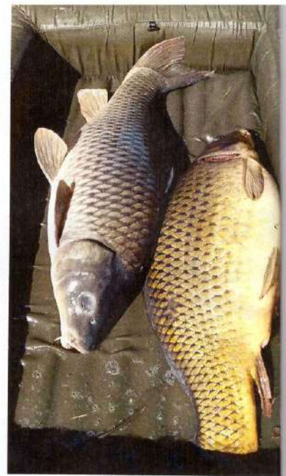
A hosszú testű, nyurgaszerű pikkelyes pontyok az RSD jellegzetes halai

A hosszú évek óta tartó következetes horgászszövetségi munkának és a pontyok szigorú védelmének köszönhetően nagyon sok 20 kilón felüli ponty található az RSD-ben