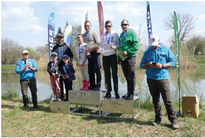
A profik dobogója