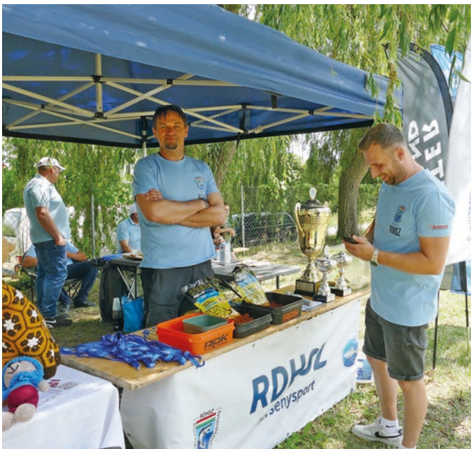
A hangulat a pult mindkét oldalán jó volt