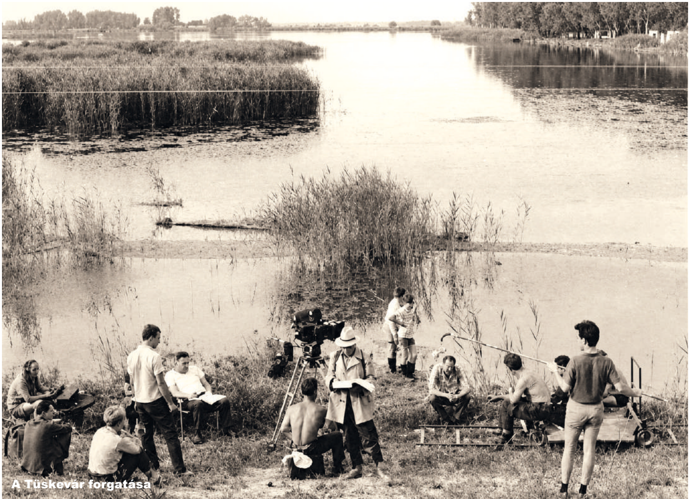
A Túskevár forgatása