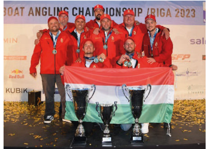
2023. VB Lettország Rigában (a teljes magyar csapat)