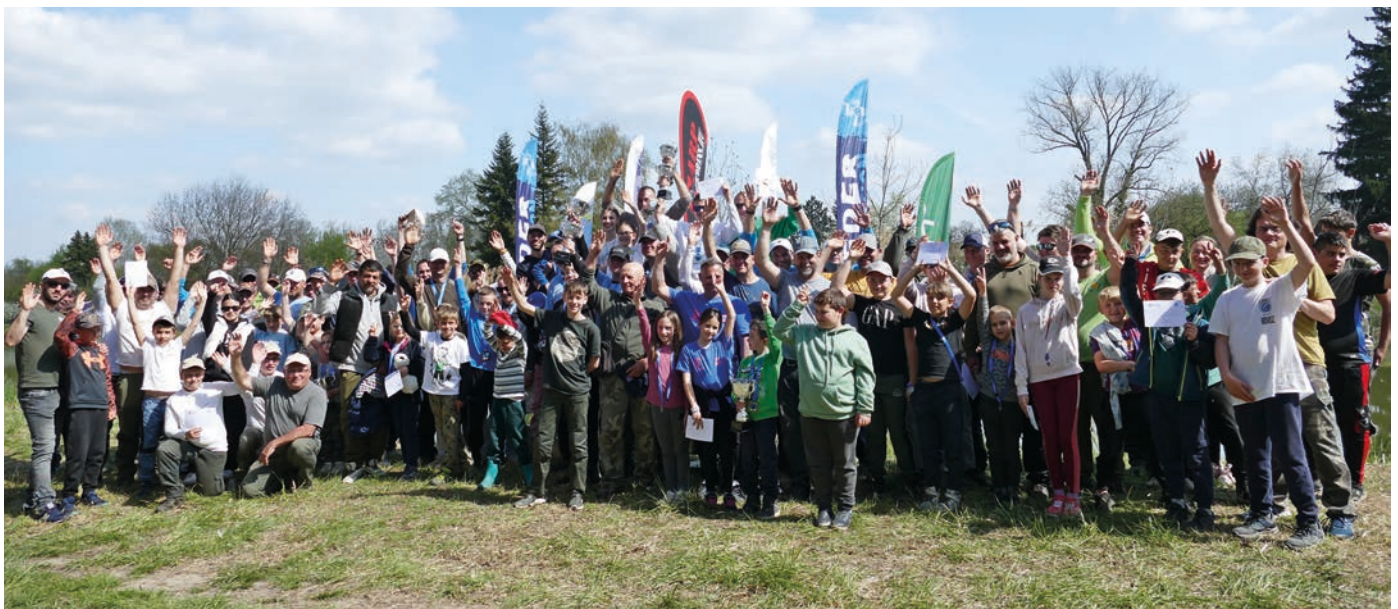
Jövőre veled ugyanitt!

A horgászat 10:00 órakor vette kezdetét és 13:00 óráig tartott. Szigorú szabály volt, hogy a kezdő és záró sípszó között nem volt egyéb jelzés, így a résztvevőknek önállóan kellett gazdálkodniuk az idejükkel. „A kevesebb néha több” elvét követve a technikai precizitás és a türelem hozta meg a sikert. A versenyt követően közös ebédre, majd az ünnepélyes eredményhirdetésre került sor.