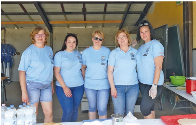
A lányok, a lányok, a lányok angyalok