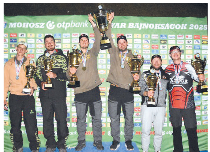
2025. Országos Bajnokság Tisza-tó (a dobogó csúcsán)