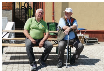
Istvánok egymás közt