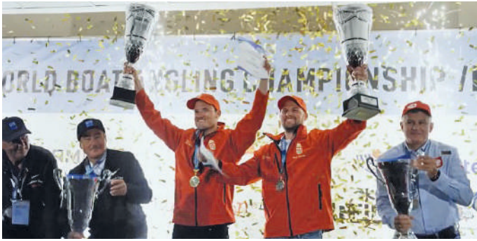
2023. Lettország Riga (a dobogó csúcsán)