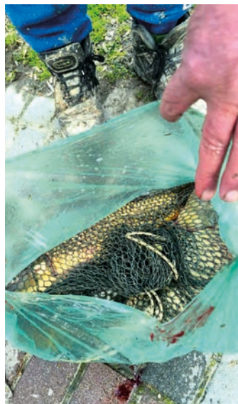
Lopásra előkészítve a zsákmány