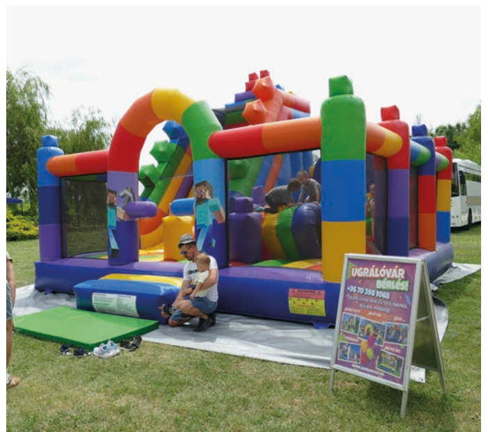
A megunhatatlan ugrálóvár