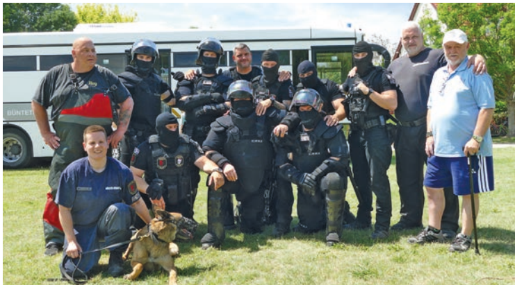
Köszönjük a BV Csapatának a magas színvonalú bemutatót!

Az ebéd, palacsinta, jégkrém, üdítő után pedig megkezdtük a délutáni programot. A BV csapata nagyon komoly, de ugyanakkor gyermekközpontú bemutatóval készült, kicsik és nagyobbak egyaránt élvezték a programot. A végén tömegével készültek a közös fotók, fogyott minden, elkezdődött a várt rajzverseny is, elfogyott a jégkrém is.