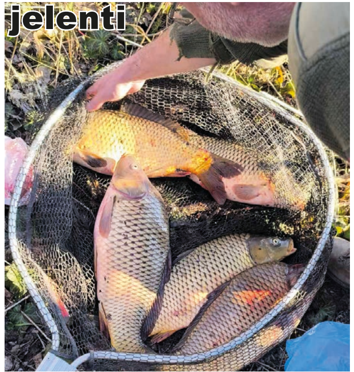
Előkerül az eldugott hal