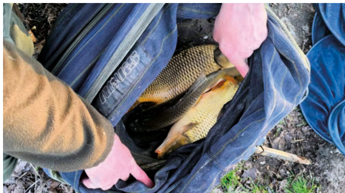
Ha a háromból csak egy van beírva, az bizony nem törvényes!

Állandóan hangsúlyozzuk, hogy nem szabad elfelejtenünk azt a tényt, hogy a legtöbb esetben halmazat is felmerül (pl. a tilalmi időben horgászó túlméretes halat visz el, vagy a jogosulatlanul horgászó több halat visz el a kelletténél). Ez esetben a súlyosabbik ügye kerül a fenti statisztikába. A közigazgatási bírságok összege 10.000–300.000 Ft között mozgott, nagy átlagban 65.000 Ft volt. Az eltiltások 3–15 hónap között mozgottak, jellemzően 6 hónapot szabtak ki a területi halgazdálkodási hatóságok. A helyi szabályok megsértőire (pl. őrizetlen-, vagy kivilágítatlan készség) írásbeli figyelmeztetést szab ki első alkalommal a halgazdálkodási hatóság. Indokolt esetben szab ki az ügyvezető igazgató – halórzési ágazatvezetői felterjesztésre – több éves saját vízterületről történő eltiltást, túlméretes ponty élve elszállítási kísérlet (ellopás) miatt,