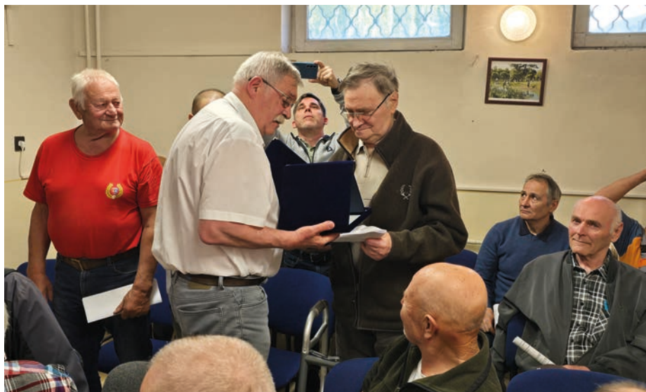
Csepel Horgász Egyesület Örökös Tisztségviselője cím átadása

A Felügyelő Bizottság értékelése megerősítette, hogy az egyesület stabil gazdasági alapokon működik, és maradéktalanul betartja a vonatkozó szabályokat. A küldöttek valamennyi