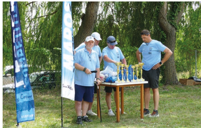
Kezdődik az eredményhirdetés