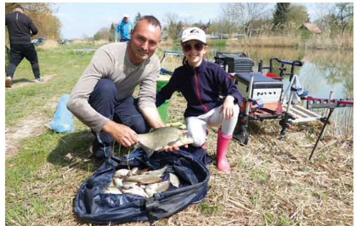
A győztesek terítéke