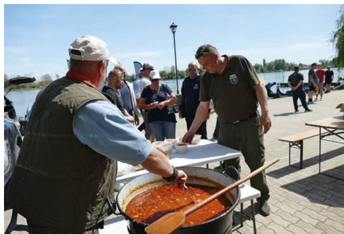
A menyei bagulyás

Szeretnék köszönetet mondani a támogatóinknak: a MAROS-MIX, a Benzár, a DOVIT, a Timár-Mix, a Hivatásos Halóreink, Versenysportosok, IOB tagok, a Ráckevei Horgász Egyesület, a helyi Önkormányzat, és persze az RDHSZ. Nélkülük, a munkájuk, támogatásuk nélkül nem juthatott volna el a fiataljainkhoz az a 361 000 Ft, amit egy nagyszerű programmal