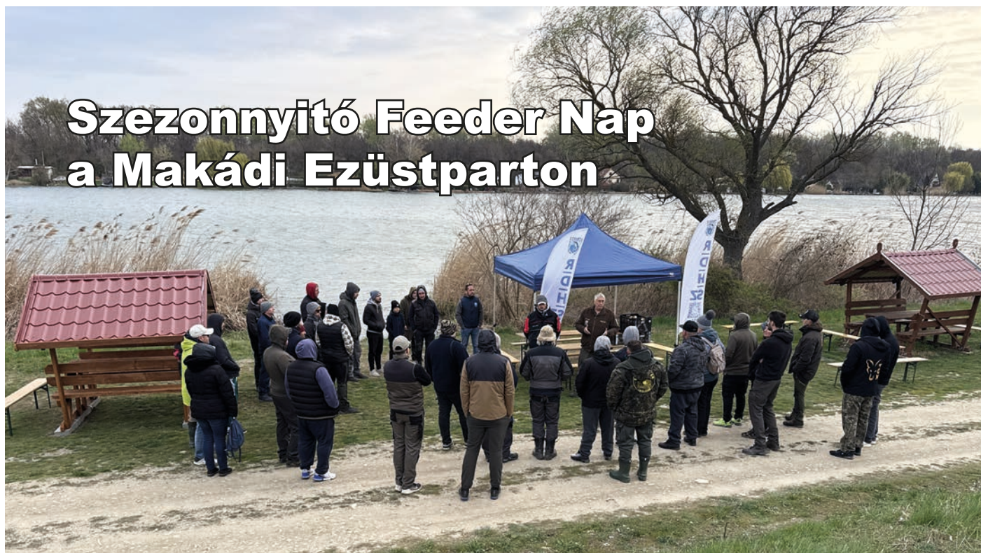
A hagyományteremtő rendezvény megnyitója

2026. március 28-án (szombaton) került megrendezésre a Ráckevei (Soroksári)-Dunán, a Makádi Ezüstparton a Szezonnyitó Feeder Nap, amely a várakozásoknak megfelelően sikeresen és jó hangulatban zajlott le. A ren-