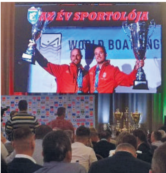
2023. „AZ ÉV SPORTOLÓJA” cím átvétele a Horgász Gála ünnepségen Gödöllőn