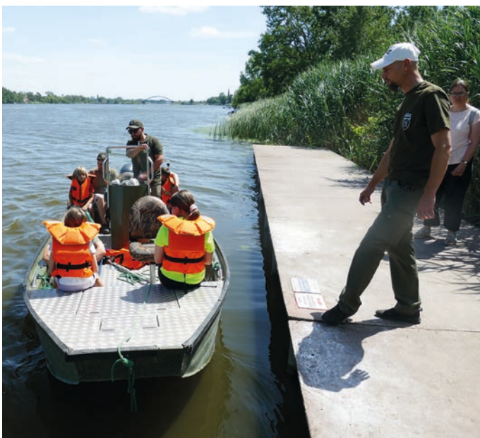
A halőrök motorcsónakáztattak