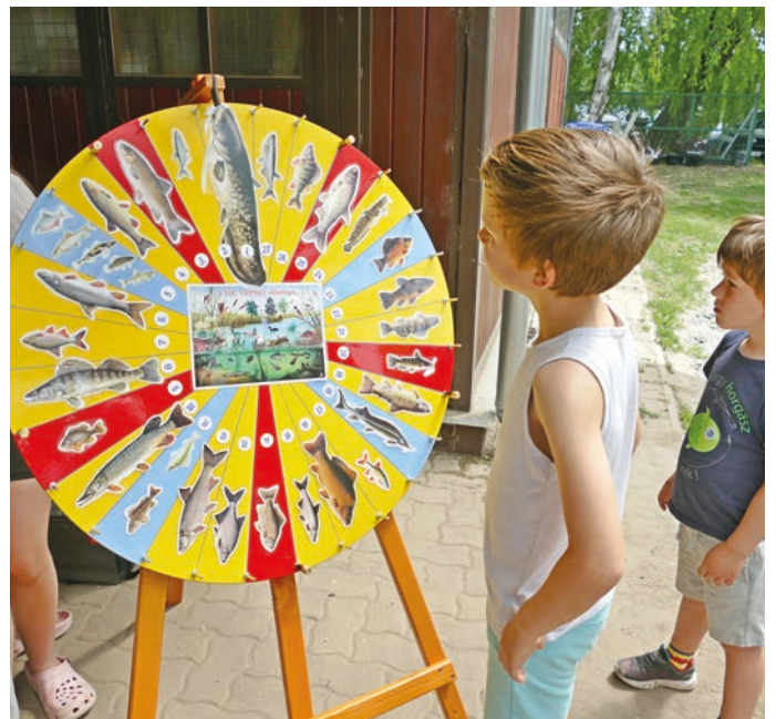
A Deme-féle halkerek