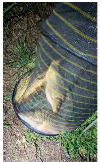
Sötétben is megtaláljuk a lopott halat!

illetve kiemelten üldözendő nagyvételű hallopás, visszaeső elkövetés, orvhalászat miatt, valamint halóreinket érő inzultus-, vagy az intézkedés akadályozása miatt.