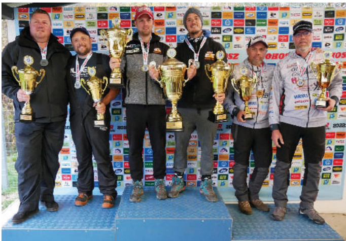
2022. Országos Bajnokság Fehérvárcsurgón (a dobogó csúcsán)