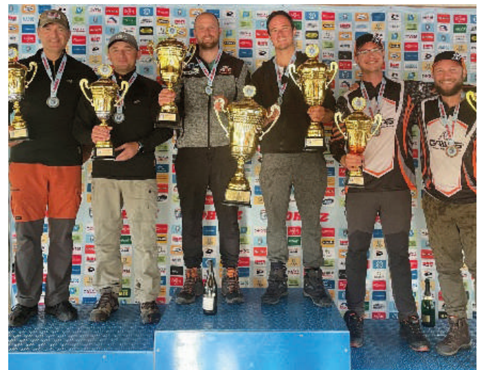
2023. Országos Bajnokság Tisza-tavon (a dobogó csúcsán)