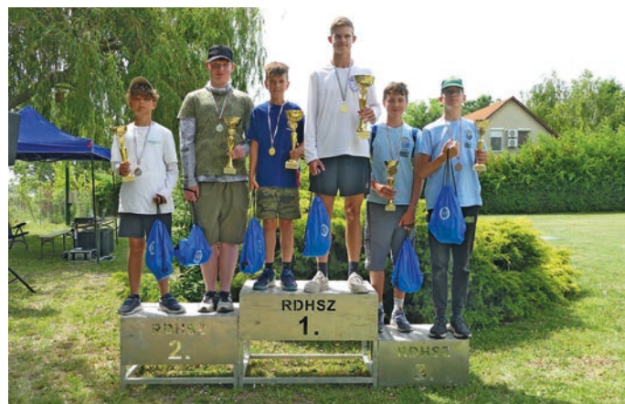
Kicsik és nagyok közös dobogója