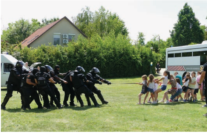
BV és a gyerekek kötélhúzása