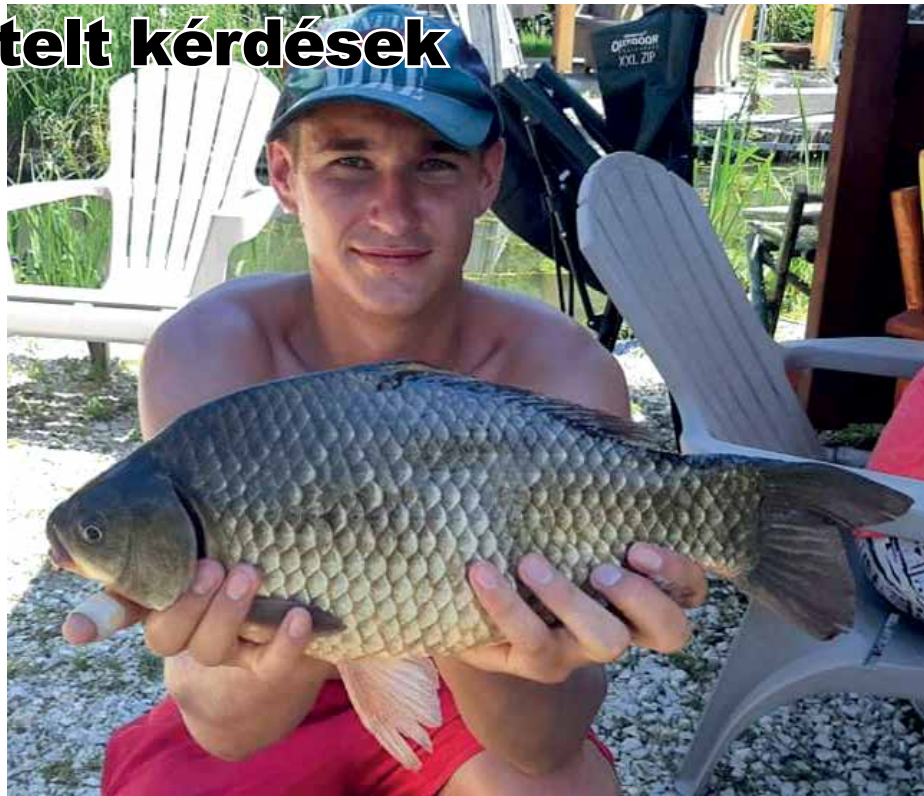
Közel 2 kg-os ezüstkárász az RSD-ből

Az 1954-ben Bulgáriából betelepített ezüstkárász mára minden hazai vízünkben megtalálható, rendkívül agresszív terjeszkedésének köszönhetően. Ez a nagyon szívós, extrém szélsőségeket is elviselő faj az ősho-