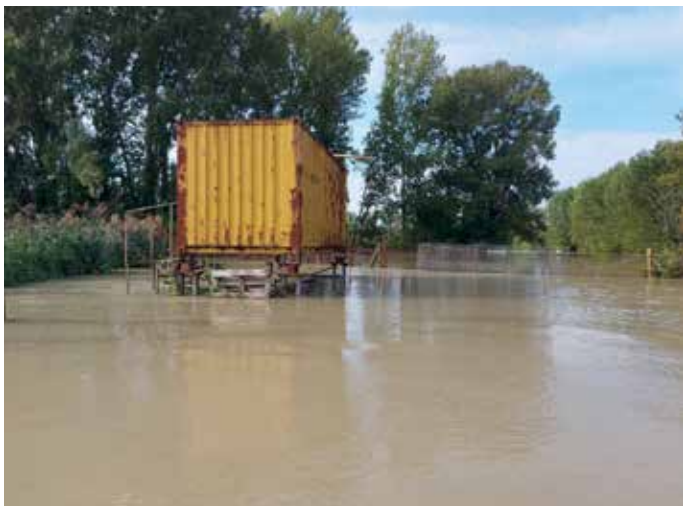
2024. évi árvíz, felső halágy lejárata, konténer