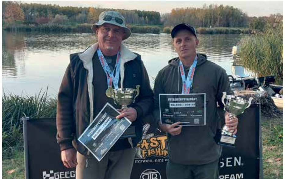
A győztes páros

A taktikánk a csukákra alapozott, mert minden centi számít, és bíztunk benne, hogy sikerül néhányat becsapni a körforgókkal a partmentén, de ha nem, akkor a kőszüllőkből minden bizonnyal össze tudunk fogni néhány