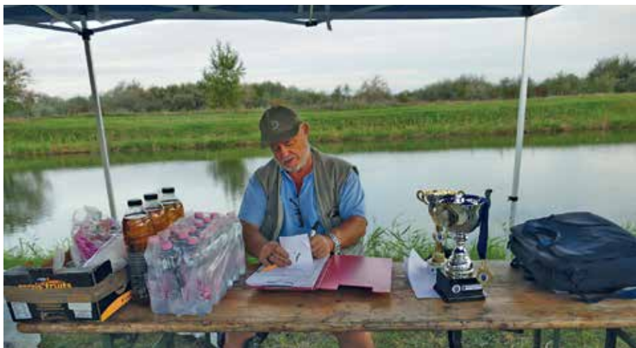
Regisztrációs ponton a Főszervező