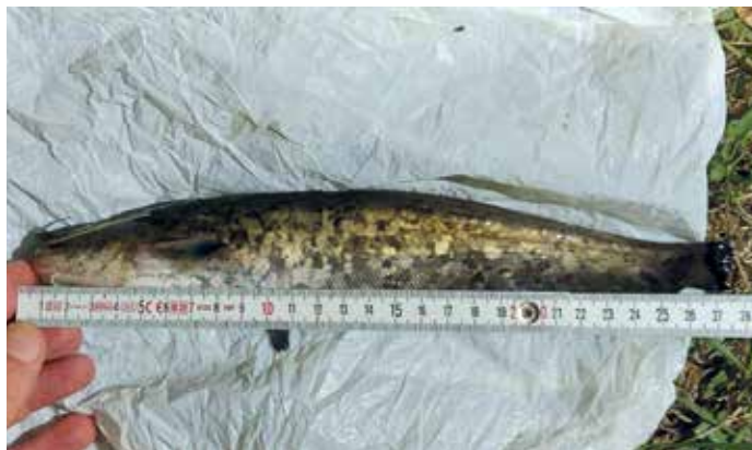
Mini harcsa nem konyhára való

A helyi szabályok megsértőire (pl. őrizetlen készség) írásbeli figyelmeztetést szab ki első alkalommal a halgazdálkodási hatóság. Indokolt esetekben szabott ki az ügyvezető igazgató – ágazatvezetői felterjesztésre – 1-2 éves saját vízterületről történő eltiltást, túlméretes ponty élve elszállítási kísérlet (ellopás) miatt, illetve kiemelten üldözendő nagytételű hallopás, orvhalászat miatt.