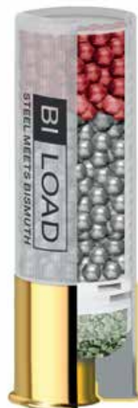
Bi-Load sörétes lőszer kiszerelese