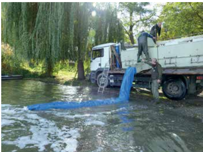
2024. októberi haltelepítés

Gyönyörű, egészséges a saját termelésű telepítőanyag