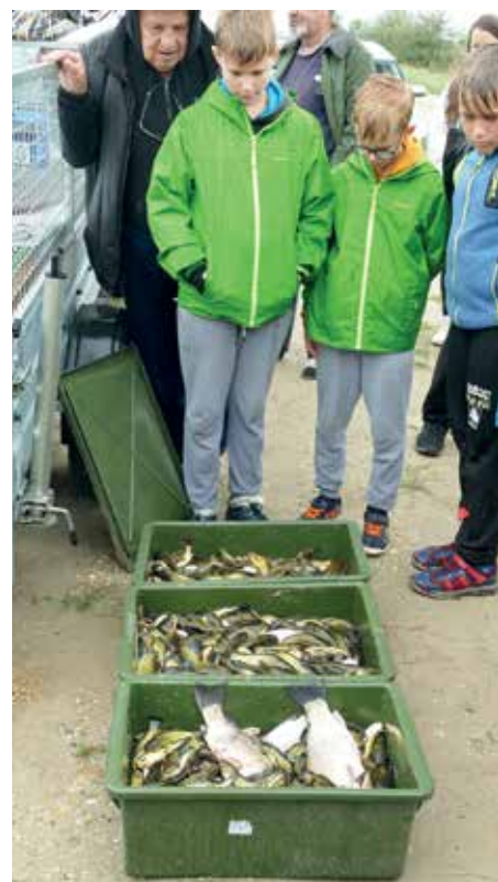
Az inváziós halak a madárkórházba utaznak – csemege a lábadozó madaraknak