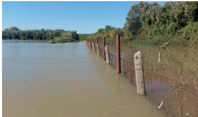
2024. évi árvíz, kerítés

a 2013-as rekord árvízé. A víz a kerítésdrót tetején sehol nem bukott át. A nagymennyiségű (mintegy 170 000 kg) halastavi ponty állomány helyben tartása érdekében a halakat még az árvíz idején is megettük. Az apadás – az áradás dinamikájához hasonlóan – gyorsan lezajlott, helyenként gyors áramlású területek voltak tapasztalhatók a visszahúzó vízrel. 2024. szeptember 24-én már munkagépekkel, másnap pedig már személygépkocsikkal is járhatóak voltak a tógazdaság központi útjai. Rögtön el is kezdtük a kárhelyreállítást. Az elöntött épületekből az iszapot és hordalékot kellett kilapatolni, a korábban kimenekített halászati eszközöket, munkagépeket visszahelyezni eredeti rendeltetési helyükre. A levonuló árhullám után láthatóvá váltak a kerítések is, amelyeknek az alsó részén sajnos keletkeztek újabb lyukak, a nagy energiájú árvíz sodrása ugyanis több helyen is alámosta a kerítésrendszert. A megtermelt jó minőségű halállomány (zömében III. nyaras ponty) egy része emiatt biztosan ki tudott szökni, amit jól példáznak sajnos a HOFESZ kezelésű Nagy-Duna és Tassi V–VI-os vízterület kimagasló pontyfogási eredményei az árvíz levonulása utáni napokban. A halállományban keletkezett kár mértéke csak a halastavak teljes lehalaszatát követően, várhatóan 2024. novemberre realizálódik az RDHSZ számára. A 2024.