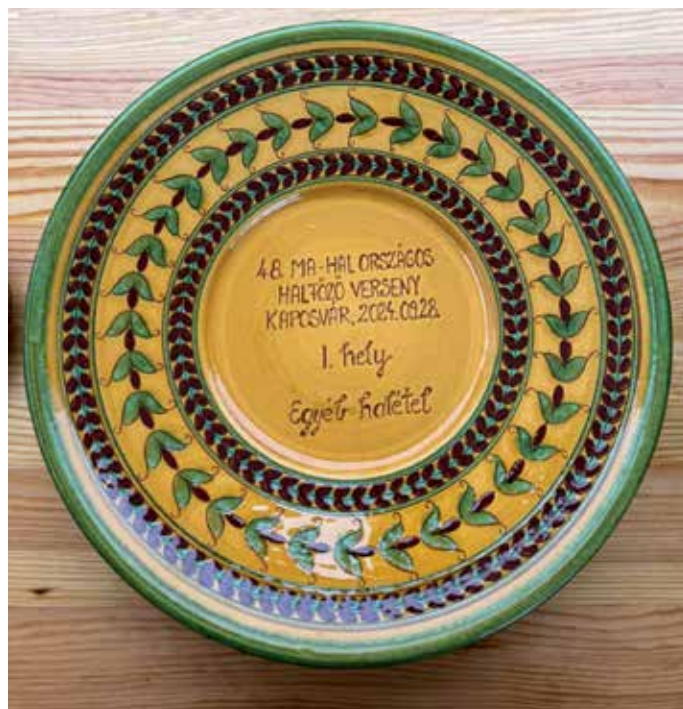
Egyéb halétel 1. hely

Ez a győzelem újabb mérföldkő az RDHSZ számára, hiszen a halfőző versenyeken korábban is számos sikert arattak. A mostani első hely megerősítette pozíciójukat az ország legjobb halfőzői között, és bizonyítja, hogy a csapat minden tagja komoly szenvedéllyel és elhivatottsággal áll a gasztronómia és a halas ételek népszerűsítése mellett.