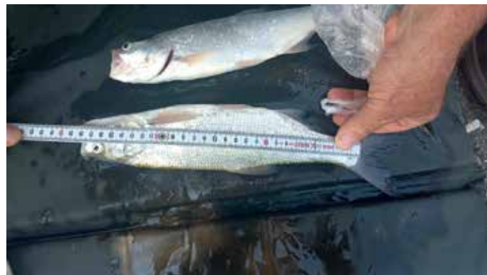
Sajnos a kisbalinokon már nem lehetett segíteni

A szembeötlő növekmény okát keresve el kell mondanunk, hogy a jelentősen megszaporodott a külföldi – jellemzően ukrán – elkövetői kör a Duna-ág felső szakaszán, mely Csepel-Dunaharaszti között folyamatos munkát ad szolgálatunknak. Divatos lett a méret alatti halak (ponty, balin, harcsa) elvitele, még az engedéllyel egyébként rendelkező „sportársak” között is. Nem szabad elhallgatnunk azt sem, hogy a Halóri Szolgálatnál bekövetkezett technikai fejlesztések, személyi változtatások jótékony hatása is érződik a minőségi halóri munkán. A halóri járőrök hatékonyságának növekménye jól látható. Kijelenthetjük, hogy az RDHSZ halóri gárda munkatársai elkötelezettek és munkájukat az elvárt színvonalon végzik. Azonban ezek mit sem érnének önmagukban, ha a kedves Horgásztársak nem segítenék munkánkat!