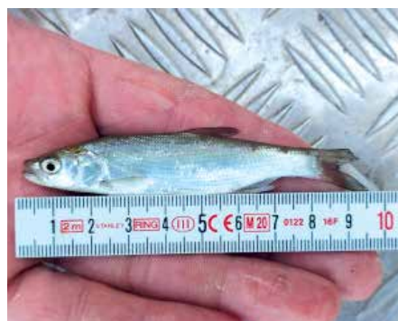
2. kép: Méretén aluli balin

tévedés, ezért egy rövid képes tájékoztatóval segítünk megelőzni a bajt. Az első képen felül egy küsz láthatunk, alul pedig – sajnos már fej nélkül – egy ivadék balin van. Jól látszik, hogy a balin pikkelyei jóval kisebbek, és ha lenne feje, akkor a sokkal nagyobb száj is fel-tűnő lenne, ahogy az a második képen látható.