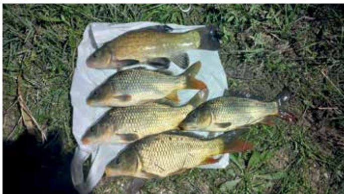
Itt bizony halmazat van

Nem szabad elfelejtenünk, hogy a legtöbb esetben halmazat is felmerül (pl. a tilalmi időben horgászó méret alatti halat visz el, vagy a jogosulatlanul horgászó felső méretkorlát feletti halat visz el stb.). Ez esetben a súlyosabbik ügye kerül a fenti statisztikába. A közigazgatási bírságok összege 10 000–300 000 Ft között mozgott, nagy átlagban 65 000 Ft volt. Az eltiltások 3–15 hónap között mozgottak, jellemzően 6 hónapot szabtak ki a halgazdálkodási felügyelők.