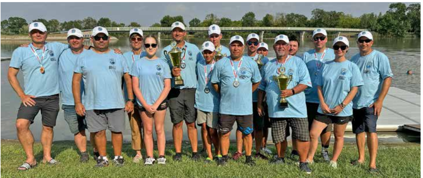
Az RDHSZ bronzérmes csapata

Ha az elmúlt évek statisztikáját nézzük, akkor egy évtől eltekintve minden évben jobbat horgásztunk a második fordulóban, mint az elsőben. Bízunk benne, hogy ez a sorozat nem fog megszakadni idén sem. Este mindenki pótolta a hiányos szereléseket, ezzel is hangolódva a második, minden eldöntő fordulóra. Abban bízunk, hogy több hal lesz vasárnap a pályán és az eddigi taktikánk működni fog idén is. Tudtuk azt is, hogy rajtunk kívül sok jó csapat és horgász van a mezőnyben. Nem cseréltünk, maradt a szombati felállás. Vasárnap aztán teljesen felborult a pálya, volt olyan szektor, ahol az első órában szinte alig