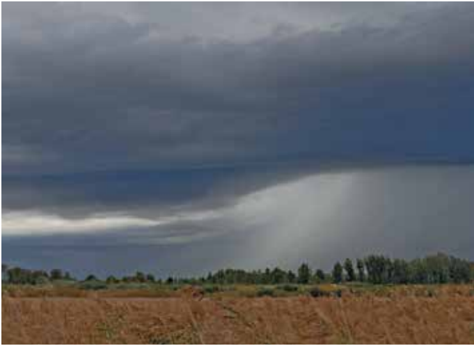
Eső előtti hangulatkép