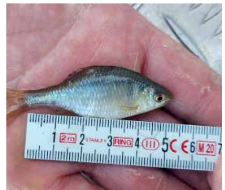
3. kép: Szivárványos ökle

tévedés, ezért egy rövid képes tájékoztatóval segítünk megelőzni a bajt. Az első képen felül egy küsz láthatunk, alul pedig – sajnos már fej nélkül – egy ivadék balin van. Jól látszik, hogy a balin pikkelyei jóval kisebbek, és ha lenne feje, akkor a sokkal nagyobb száj is fel-tűnő lenne, ahogy az a második képen látható.