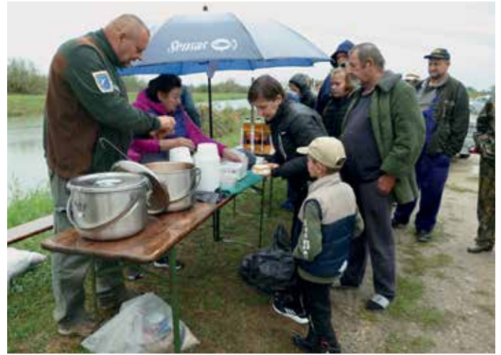
Jól esett a meleg ebéd a megázott pecásnak

Eközben a népes felnőtt mezőny cseppet megfogyatkozott a vihar alatt, hiszen nem mindenki szeret esőben-szélben horgászni, de a távozók is leadták a fogott halakat a rendezőknek, szépen gyűlt a zsákmány. Közben innen-onnan szép compóról, több pontyról is érkezett hír, szeretett vizem nem bánt fukarul a kitaró horgászainkkal, szép dévérek, karikák is tettek látogatást a horgainkon. Összességében jó kis horgászat kerekedett, hiszen az elszállított inváziós halak