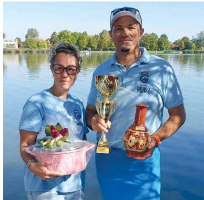
Az Őszi Ászok Fesztivál trófeáival