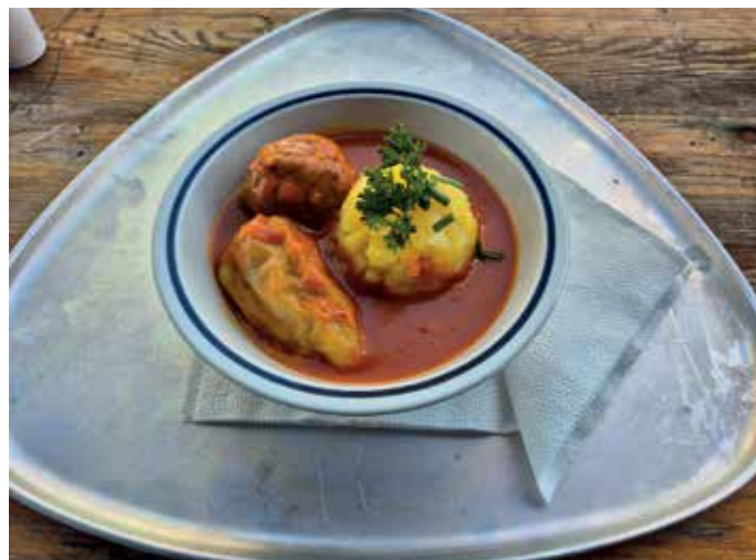
Halas töltött paprika a gyöztés halétel