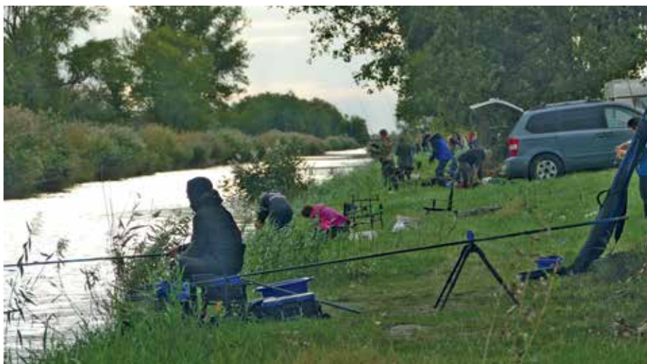
Indul a Törpefogó!