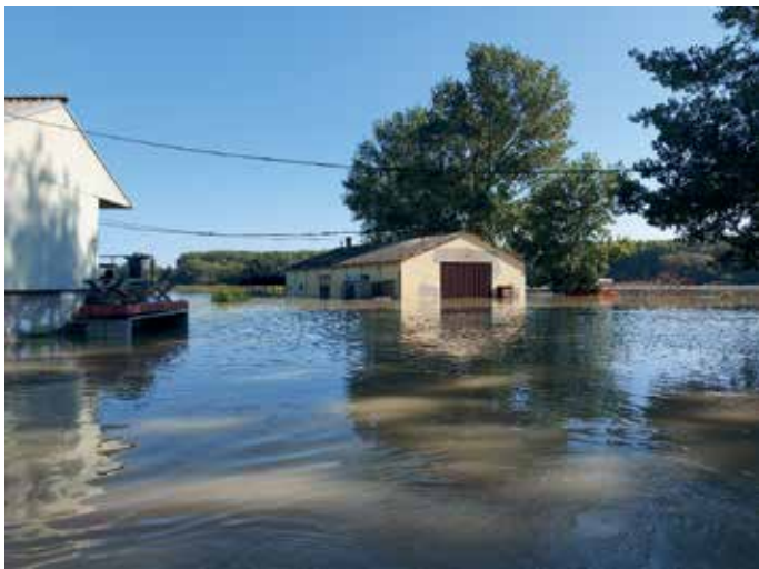
2024. évi árvíz által elöntött gazdasági épületek