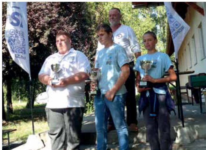
RDHSZ Casting Junior Kupa dobogósok

A jó hangulatú eredményhirdetés után elfogyasztottuk az üstben elkészült ebédünket, majd búcsút vettünk szlovák barátainktól, akik még hosszú út előtt álltak, hiszen Érsekújvárig tart nekik a hazatérés. Gyors pályabontás, pakolás, szemétszedés után jókedvvel indultunk haza, átadva a pályát és az épületet a község Öregfiúk Csapatának, ezúton is köszönve a lehetőséget és a munkájukat, és reméljük 2025-ben is megrendezhetjük ezt az egyedülálló versenyt.