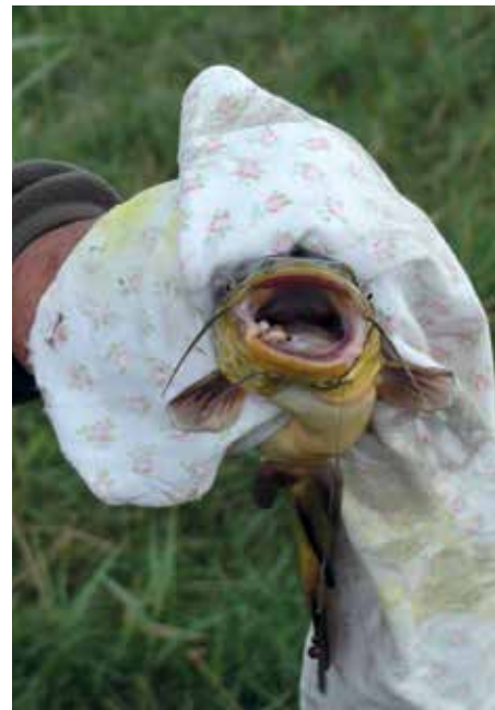
Egy darabosabb törpe

sal, a második pedig a Széchenyi Általános Iskola Szigethalomról 4531 grammnyi halat gyűjtve. Mindannyian boldogan vették át az ajándékokat, a kupákat és az érmeiket, jó volt látni a zord időben a mosolygós gyermekeket a küzdelem végén.