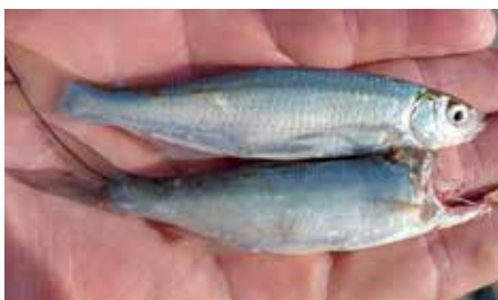
1. kép: Egy küsz és egy fej nélküli balin

Az utóbbi időben egyre többször találkozunk halóreink méretén aluli nemes hal (pl. balin) vagy védett faj (pl. szivárványos ökle) csalihalként való felhasználásával. Mindkét cselekmény a halgazdálkodási törvény elleni szabálysértés. Ilyenkor a halórnek nincs mérlegelési jogköre, sajnos minden esetben be kell vonnia az állami jegyet, és feljelentést kell tennie. Tisztában vagyunk azzal, hogy az ilyen szabálysértések nagy része jóhiszemű