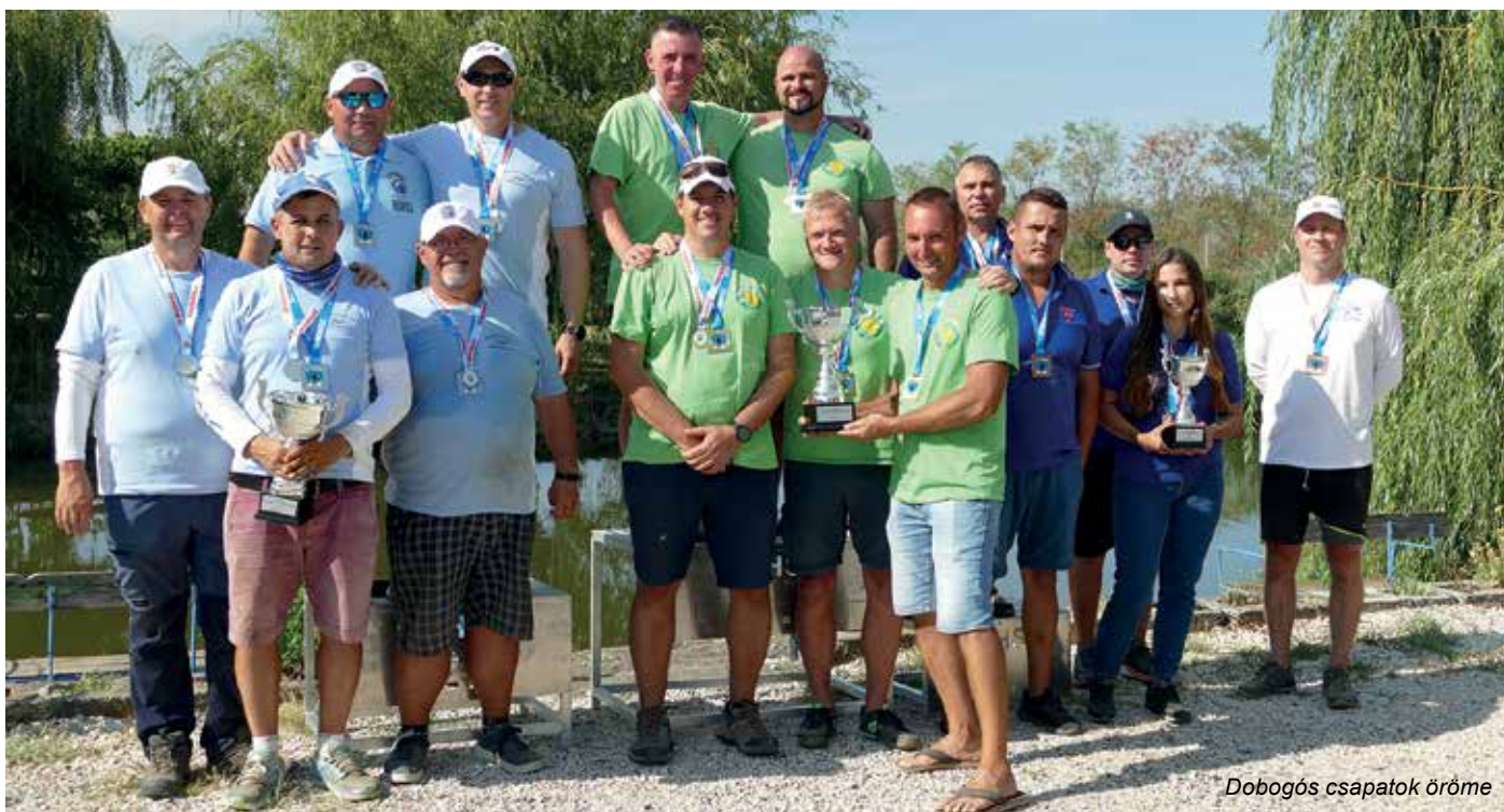
Dobogós csapatok öröme

a jövőben egy fix versenypályánk is, akár a tavaszi versenyein is ideális helyszín lehet. Nagyon fontos számunkra és ezt mindig mérlegelnünk kell a kecsegtető fogási lehetőség mellett, hogy a részvétel olyan egyesületek