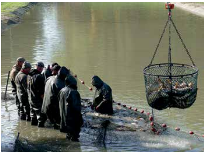
Makádi Tógazdaság 2024. októberi lehalászat