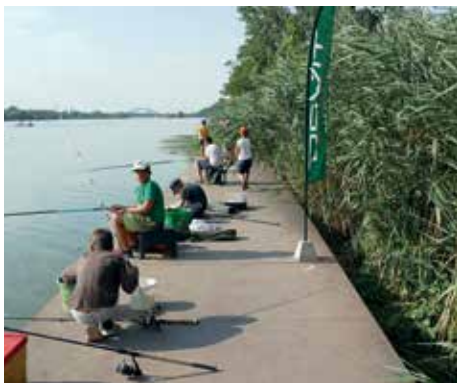
Horgászat Ráckeven az RDHSZ stégjéről