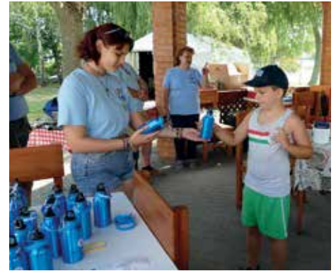
A környezettudatosság jegyében RDHSZ emblémás kulacsokat kapnak a táborlakók