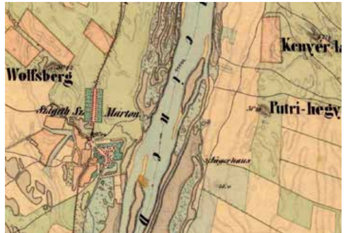
A Cseke-sziget a második katonai felmérés térképén