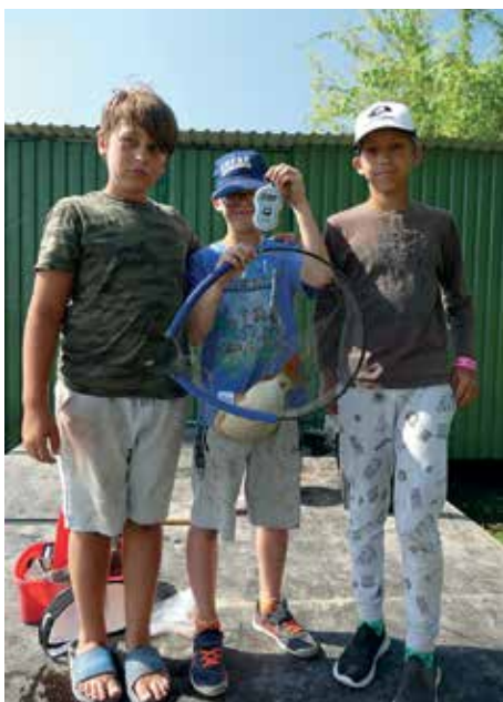
Egy szép fogás