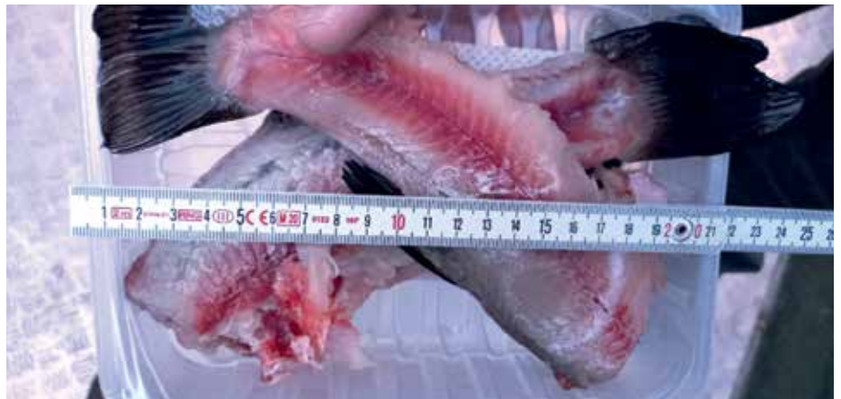
Compótörzök a mérőszalag mellett

A halóri intézkedés a szabálysértési jegyzőkönyv elkészítése mellett az állami horgászjegy és az területi jegy visszatartásával