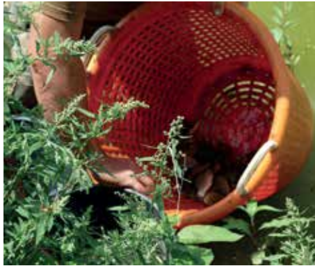
Ivadékok vizsgálata a Szigetbecsei Ivadéknevelő Telepen