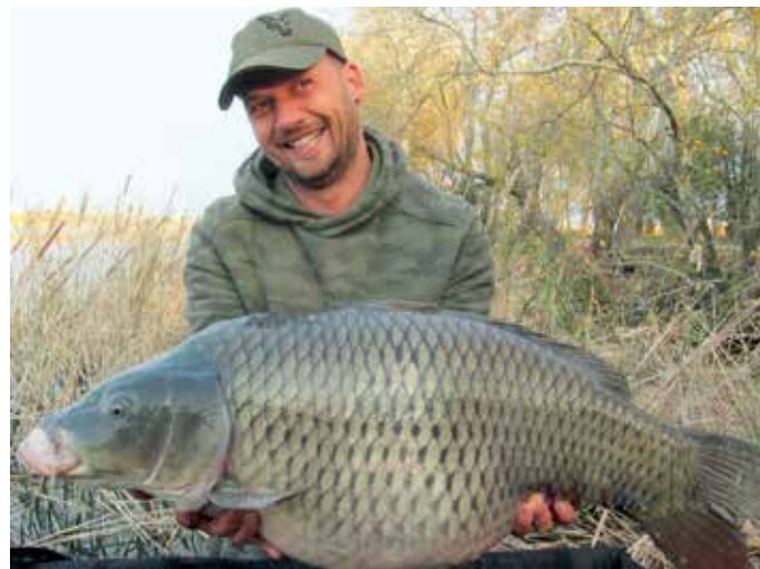
Az első rekordponty: 2018.11.18, 22,44 kg