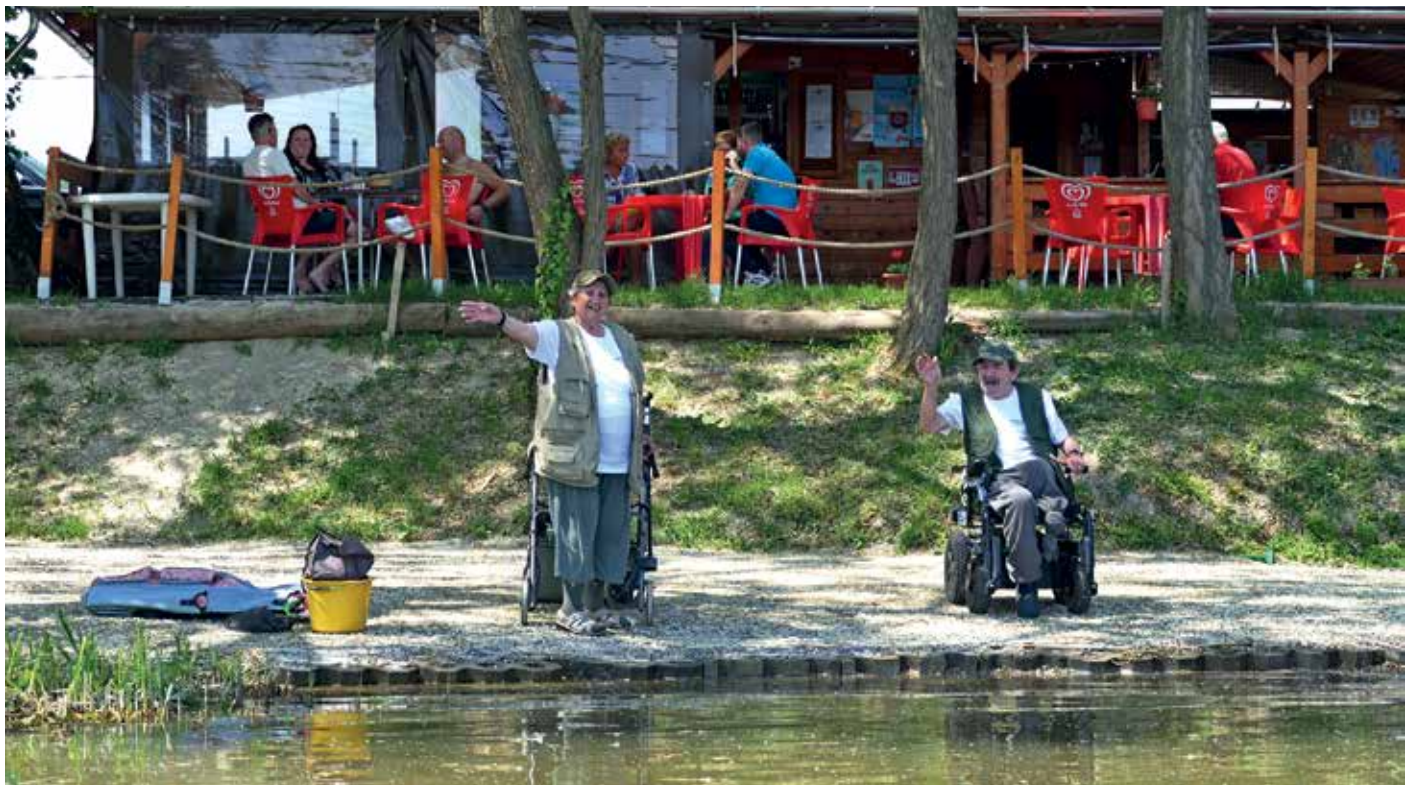
Mozgáskorlátozott horgászhelyet azonnal birtokba vevő sporttársak öröme