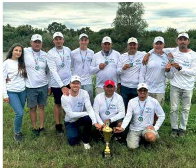
Az ezüstös Csapat

A verseny során nyújtott kiemelkedő teljesítményüknek köszönhetően a Molnár-sziget Sporthorgász Egyesület csapata a második helyet szerezte meg, amely nagy elismerést jelent a számukra. Ezzel az eredménnyel a csapat kvalifikálta magát a jövő évi világbajnokságra, amely újabb lehetőséget ad, hogy nemzetközi szinten is bizonyítsák horgásztudásukat.