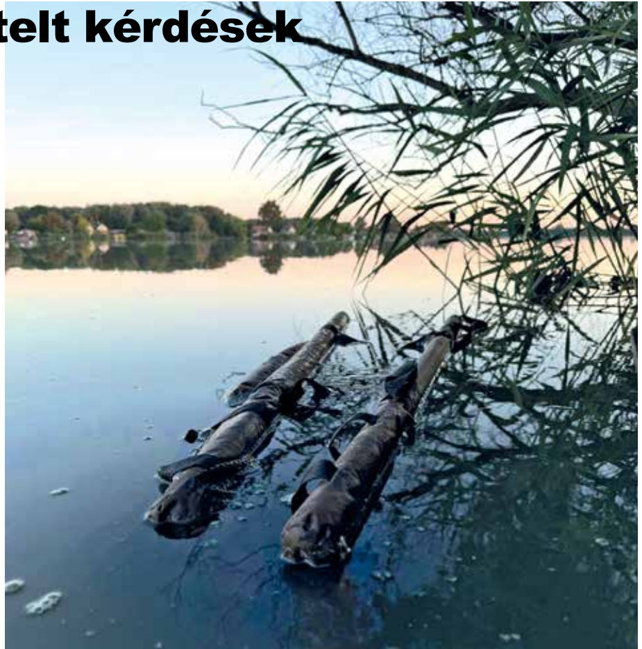
Úszó mérlegelő akcióban

Szólunk kell még a tárolás helyéről, mivel sajnos több rekordhalunk is elpusztult a nem megfelelő helyen történő tárolástól. A halat megfelelő mélységű, lehetőség szerint hűvösebb, áramló vízben kell tartani, védve a hullámzástól, valamint kímélve a felesleges zavarástól.