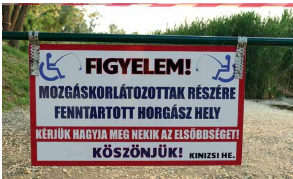
Mozgáskorlátozott horgász hely táblája