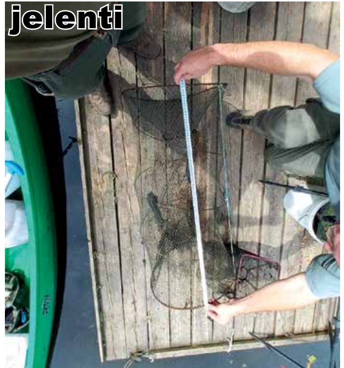
Egy lefülelt csalihalfogó varsa

A 24 órán át hívható halóri ügyeleti telefonszám továbbra is rendelkezésükre áll: +36 30 675 7304 !