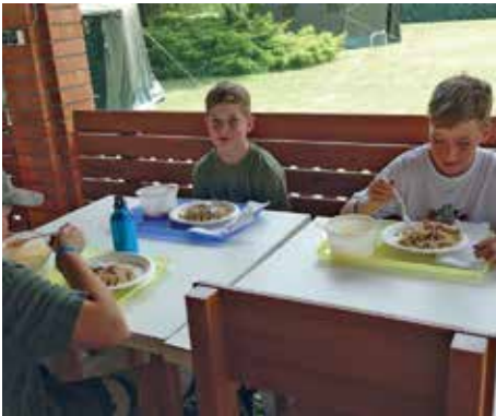
Ebéd a szeletli alatt