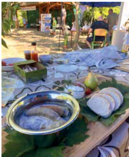
A halétel különlegesség tálalva

A zsűri és a közönség is elismerően nyilatkozott a kapros toroskáposztáról halgombóccal, kiemelve az ízek harmóniáját és az étel innovatív megközelítését. Az első helyezés megszerzése hatalmas elismerés a csapat számára, amely rengeteg időt és energiát fektetett az étel elkészítésébe és tökéletesítésébe.