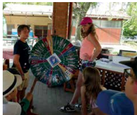
A gyerekek játékos formában a halfelismerést gyakorolják a Halkerek-Szerencskerékkel