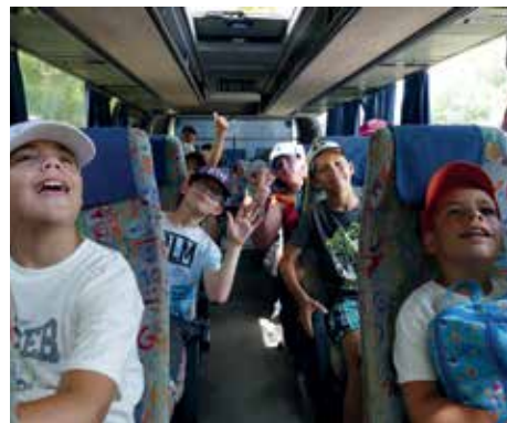
Buszos kirándulás a Szigetbecsei Ivadéknévelő Telepre