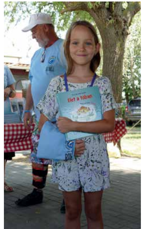
Ajándékok osztása a horgásztábor végén