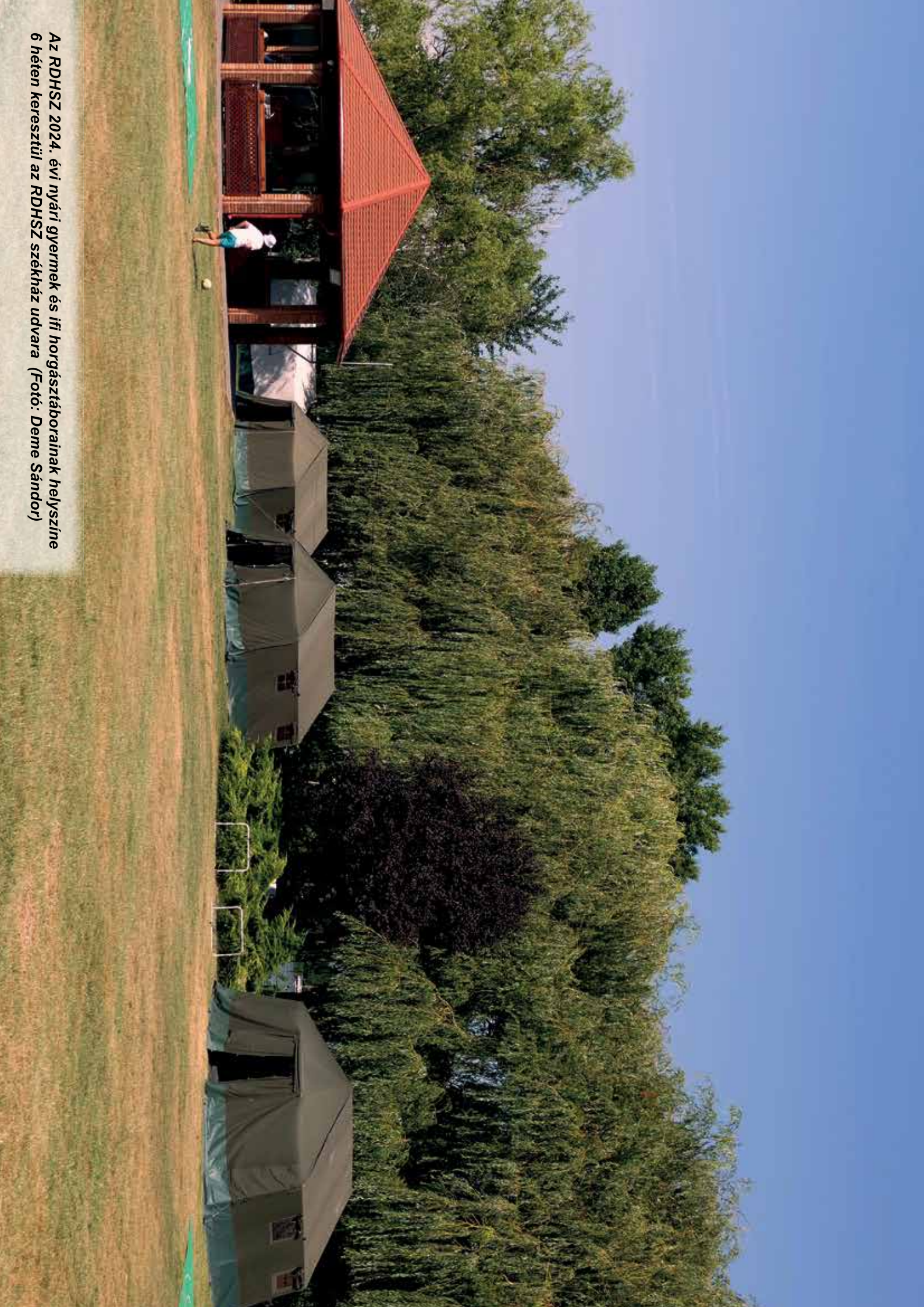
Az RDHSZ 2024. évi nyári gyermek és ifi horgásztáborainak helyszíne 6 héten keresztül az RDHSZ székház udvara