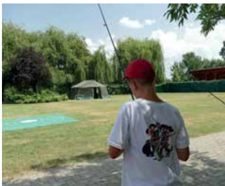
A fiúk az Arenberg-célpadobást gyakorolják