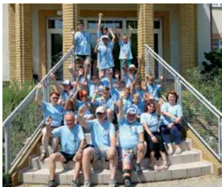
Táborzárás csoportképe – Ki akar jövőre is jönni? – Éééééééé!