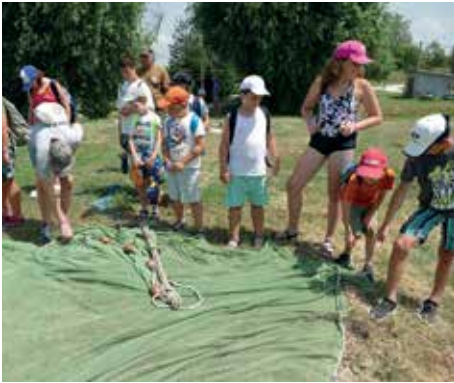
A gyerekek a halászeszközökkel ismerkednek