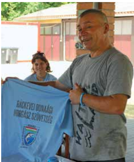
Gyulai Ferenc kétszeres egyéni úszós magyar bajnok tanítja a gyerekeket a horgászat fortélyaira