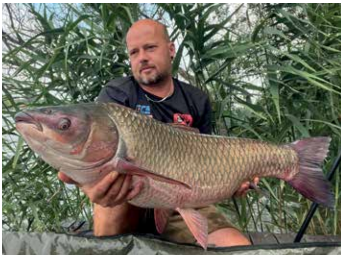
A mostani horgászat legnagyobbja: 19,7 kg

– Így van, 2018 őszén fertőzött meg a nagyhalas horgászat. Ez egy nagyon intenzív időszak volt, aminek a mai napig tart a hatása. Az őszi tilalom alatt tudatosan készültem