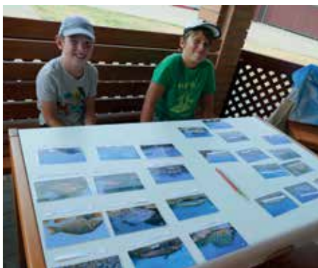
Gyakoroljuk a halfelismerést!