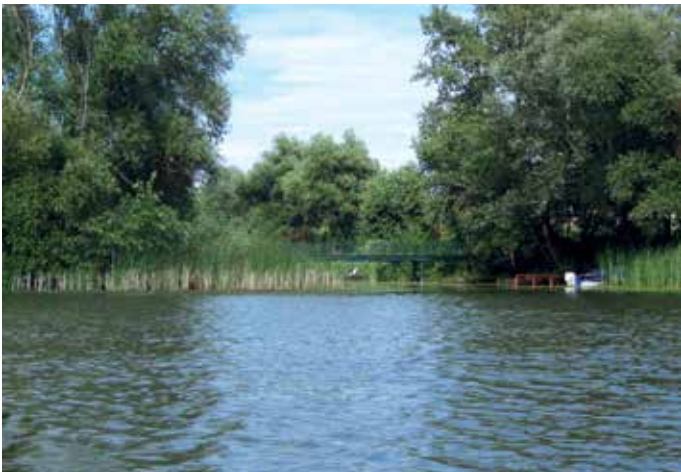
A kiság alsó bejárata a gyalogoshíddal

A sokáig lakatlan földdarab 1959-ben az Országos Vízügyi Főigazgatóság tulajdoná-