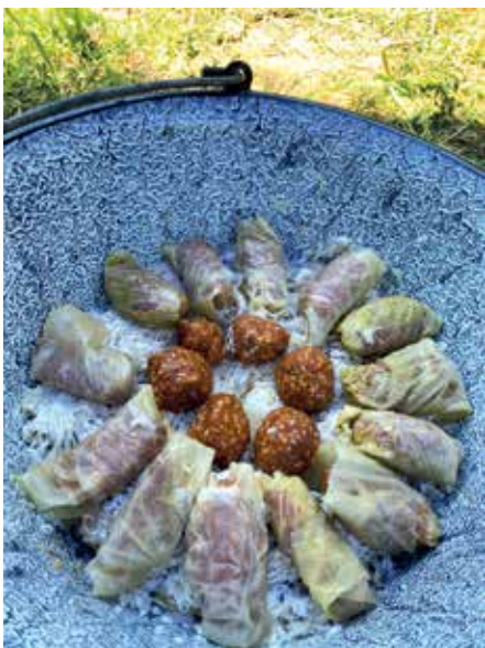
Kapros toroskáposzta halgombóccal főzésre előkészítve

A versenyre a csapat a kapros toroskáposzta halgombóccal nevű halétellel készült. Az étel különlegessége, hogy a hagyományos magyar toroskáposztát ötvözi a friss halgombóccal, amelyeket sok kaporral ízesítettek. Az étel nemcsak ízletes, de egészséges is, hiszen a hal könnyen emészthető és gazdag omega-3 zsírsavakban. A kapros ízesítés pedig frissességet és különleges aromát adott az ételnek.