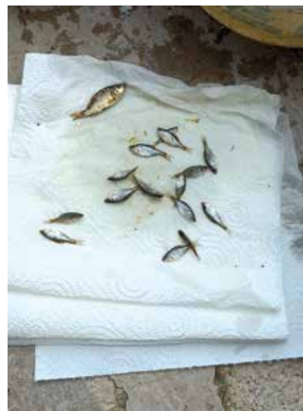
Védett szívárványos öklék és kisponty, mint csalihalak – a halvédelmi bírság és a természetvédelmi bírság is garantált