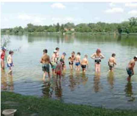
Strandolás Szigetbecsén a Ráckevei Duna-ágban