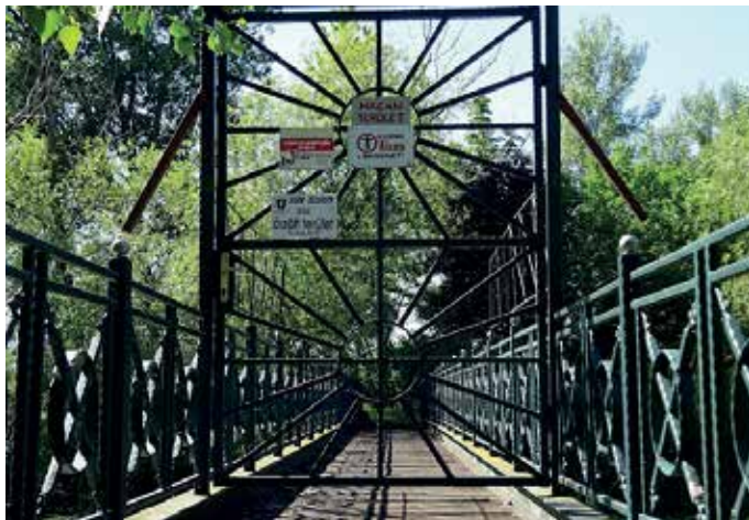
A gyalogoshíd lezárt kapuja