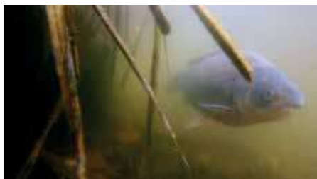
Ezüstkárász a Balabánban

A széles kárászt hosszú évtizedek óta nem láthatja átlagember. Ha egy-egy horgász azt is hiszi néha, hogy (a másik közismert nevén) „aranykárászt” fogott, általában kiderül, hogy csak egy sötétebb színű és kövérebb ezüstkárással van dolga.