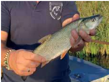
Egy átlagos méretű zsákmány

Már gyermekoromban lenyűgözött, ahogy nyári napokon az RSD fenegyerekei, a balinok fröcskölős rablásokkal kergették a kuszókat. Szórakoztató volt nézni a tükörvízen, ahogy a lábunk előtti 20 centis sekélyestől egészen a meder közepéig a teljes vízterületet bejárva csoportosan randalíroznak a kisebb-nagyobb rablóhalak. Akkor még nem ők voltak horgászatom célhalai, de felnőttként amikor pergetésre adtam a fejem, egyértelmű volt, hogy megpróbálkozom eme ragadozó keszgeféle elejtésével. Csukára már a kezdetektől eredményesen pergettem, de a balinfogások érdekes módon elmaradtak, hiába olvastam el az összes elérhető szakirodalmat, és néztem meg temérdek kisfilmet a videómegosztókon. Már-már feladtam a próbálkozást az önök elejtésére, amikor egy legyező horgász ismerősöm a kezembe nyomott néhány saját maga által kötött balinlegyet. Ezzel megnyílt a kapu egy elődeink által számtalanszor leírt, de már-már feledésbe merült módszer, a balinlegyes pergetés előtt.