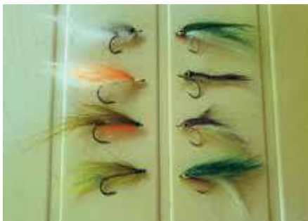
Balra a házi készítésű, jobbra a Kínából rendelt balinlegyek

A bot és az orsó minősége nagyon fontos ennél a módszernél, ugyanis viszonylag nehéz szerelést kell messzire juttatnunk, és villámgyorsan vezetnünk, ami rendkívüli módon igénybe veszi az eszközöket. A dobótávolság miatt a hosszabb, 2,4 méter körüli gerinces süllős pálcákat ajánlom, nagy áttételű (legalább 6.0:1-es) minőségi orsóval. A főzsinóron sem szabad spórolni, a csendes működés érdekében nyolcszálás fonottat szoktam használni, 0.12-es körüli méretben. Nyílt vízben, akadókát elkerülve horgászunk nem kapitális halakra, ezért elegendő a vékonyabb zsinór. A gubancmentesség viszont kulcskérdés, hiszen a nagy dobósúly miatt egy nem várt csomó nem csak a csali elvesztését, hanem akár a bot törését is eredményezheti. Mint minden pergető módszernél, itt is nagyon fontos a fék precíz beállítása, a hirtelen kapások közben fellépő erőhatások könnyen a vékony flourecarbon zsinór szakadását eredményezhetik, a túl lazára hagyott fék pedig a biztos akadást veszélyezteti.