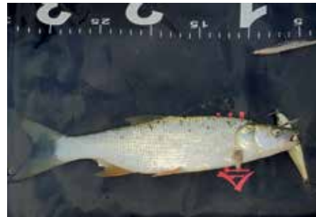
A 2024-es szezonnyitó balin

Ez a sportos módszer májustól szeptemberig szinte mindig meghozza a fogást az RSD-n. A kapitális balinok eddig elkerültek, viszont 20 centistől 3 kilósig mindenféle méretűt sikerült