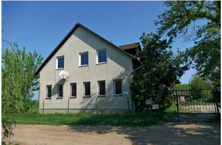
Délpesti H.E. horgásztanya Dömsöd

Számtalan filmfelvétel, újságcikk mellett, már videokazettán is megtekinthető Egyesületünk másik büszkesége, a Budapest vonzaskörzetében fekvő Délpesti horgászó, mely méltán híres fogási eredményeiről. Bátran állítjuk, hogy nemcsak a mi, hanem a társegyesületek tagjai között is népszerű lett horgásztavunk. Bizonyítékkal szolgál az évi több ezer idelátogató horgász, és az egy főre jutó fogási átlag, mely egyedülállóan minden évben 90 kg fölött volt.