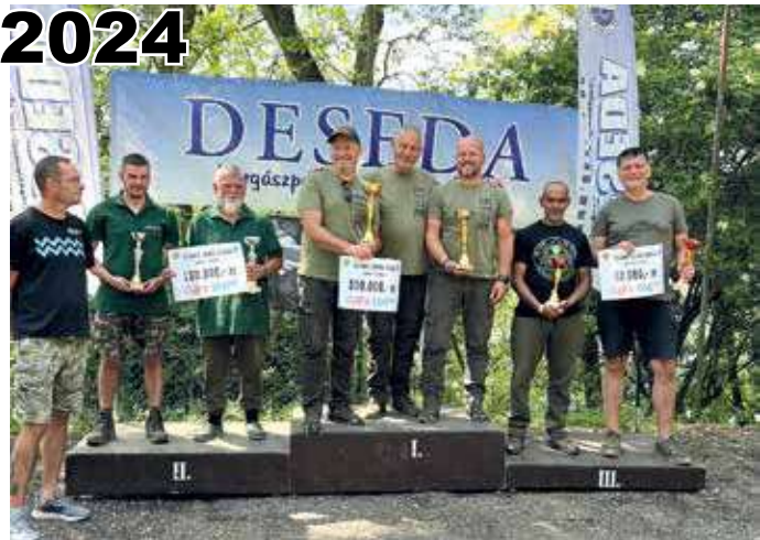
Dobogó I. hely

A verseny nagy részében az összetett 3–7 hely között helyezkedtünk el, de nem voltunk nyugodtak, hisz tudtuk, jönni fog egy markáns