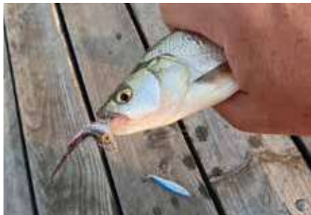
A műlégyre a kisebbek kapnak

A balinlegyes pergetés döntően felszíni horgászat, bár vízközt is eredményes lehet. A felszínen úgy érdemes vezetni a csalit, hogy a műlégy vékony csikot húzzon víz tetején, amit a botspicc megemeléseivel és fokozatos leeresztésével lehet elérni. Erre kezdő pergetők is hamar ráérezhetnek. Általában nem okozhat problémát a hal megkeresése sem, a nyári felmelegedő vizekben a fröcskölős rablások elárujják a balin jelenlétét. A rablások jócskán túldobva, a csalit villámgyorsan vezetve könnyen kapásra ingerelhetjük a ragadozó keszgféléket. A tempós tekerés