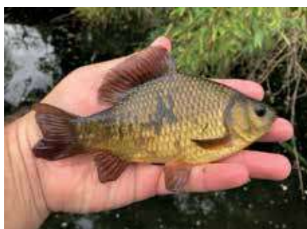
Széles kárászok különböző korosztályai