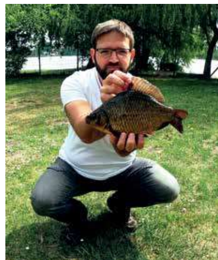
A 2019-ben fogott kapitális széles kárász fájának díszpéldánya

Itt egy állandó, önfenntartó állománya él a széles kárásznak. 2008 óta több (víz alatti kamerás) megfigyelésem, valamint helyi horgászok fogásai bizonyítják jelenlétét. 2019-ben és 2020-ban a Ráckevei Dunaági Horgász Szövetség szakembereivel tartottam anyaghalbefogásra a Balabánba, mely két halfajra, compóra és széles kárászra szólt. 2019-ben három egyed – köztük az általam valaha látott legnagyobbat – fogtuk széles kárászból, 2020-ban sajnos egyet sem.