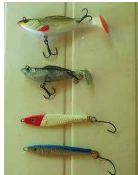
Wobler helyett ezek is működhetnek (alul a pilker)

ve működik. Tapasztalt pergetőknek egyből a Salmo Thrill juthat eszébe, amiből a 7 cm-es, snecit utánzó változat valóban eredményes lehet, nekem is ez a kedvencem. Ez a megnövelt dobósúlyú, áramvonalas, kis terelőlappal ellátott wobler igen messzire dobható, és gyorsan behúzza apró imbolygó oldalmozgásokkal ingerli kapásra a balinokat.