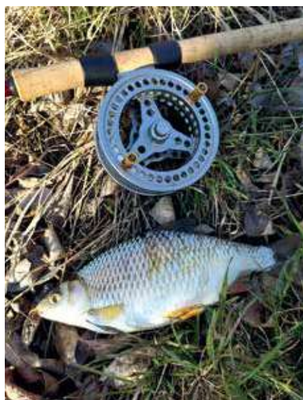
A bodri és a centrepin

lom az első tavaszi bodorkákat becserkészni, általában sikerrel. Némi gombócos etetés természetesen a hideg vízben nem árt, egyéb keszgeféléket, sügéret is horogvégre kaphatunk. Szerelékem a tőlem már megszokott módon klasszikus húrokat penget, szeretem az öreg matchbotot kombinálni az angol centrepinorsóval, igazán egyedi hangulatot kölcsönözve az úszós pecának. A hétfégi sokaságban természetesen mindenki a modernebb módszereket alkalmazza, elsősorban a feeder dívik mostanság. A tavaszi éhes pontyokat szépen fogják is a sporttársak az öböl közepéről. Magam maradok kedvenc módszeremnél, bízva a felmelegedő vízben keresgélő halakban. Bizony, élőcsalival, csontival, gilisztával termetes bodorkákat zsákmányolhatunk a tavasz első napsugaraiban, azt hiszem, ennél többet nem is kívánhat magának az igazi horgász.