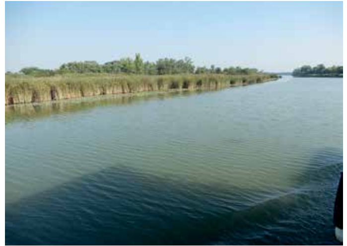
Nádas a főág felőli oldalon

szok birodalma, inkább a csónakos műfajoknak kedvez. Használható parti horgászhelyeket csak a sziget felett, a szigetcsépi öbölben lévő strand környékén találhatunk, a főágon pedig néhány száz méterrel feljebb, a Barát-ság kőolajvezeték átvezetésénél fedezhetünk fel néhány nyiladékot. A környék az RSD egyik legjobb harcsás helye, amit a korábbi