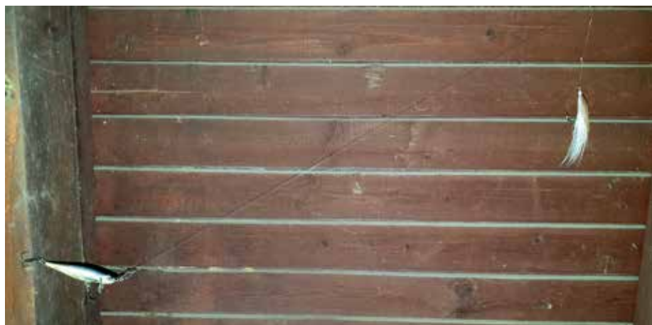
Az általam leggyakrabban használt összeállítás, Salmo Thrill woblerrel

rélhető legyen. Itt semmiképp se használjunk kapcsot, és a leágazás teljes hossza legfeljebb 10 cm legyen, hogy a műlegyet a víz felszínén tudjuk tartani.