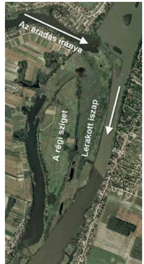
A gátszakadás hatása jól látszik a műholdképen

Az 1876-os jeges ár a Csupics-szigetre is nagy hatással volt. A hatalmas víztömeg által lerakott hordalék körbeölelte az eredeti szigetet, a kiság feltöltésével állandó összeköttetést teremtve a szárazfölddel, a következő néhány évre minden bizonyosan holdbéli tájjá varázsolva a környéket. A műholdképre tekintve tökéletesen kivehető a régi sziget partvonala, a Duna-ág jobb partján pedig egészen az Angyali-szigetig követhetjük a tovább sodort és fokozatosan lerakott hordalékcsovját.