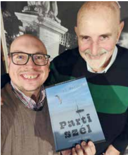
A Mesterrel és novelláskötetével

Akkoriban minden horgászműsort árgus szemekkel figyeltem, tanultam a nagyoktól szerelési technikákat, ábrándoztam távoli horgászvizekről és csodáltam az adásban bemutatott horgászfelszereléseket. Boldogan mentem tehát Édesapámmal átvenni a nyereményt, az azóta már sajnos megszűnt D.A.M Horgászcikkek boltjába, a Rákóczi térre. A nyeremény mai szemmel nézve nem volt nagy, egy sapka, egy könyv és néhány előke, de akkoriban nekem mindez felért egy lottótóttal.