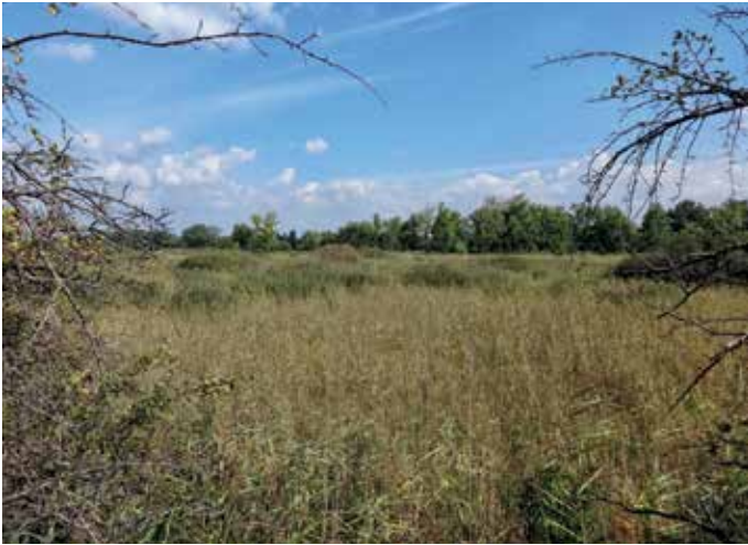
Látkép a sziget belsejéről

szatot a mellékágban megmaradt néhány engedélyezett stégről. A terület védett jellegéhez kapcsolódik, hogy a mellékágba belső égésű motoros vízi járművel tilos a behajtás, a főág teljes szakaszán pedig 5 km/órás sebességhatárolás van érvényben.