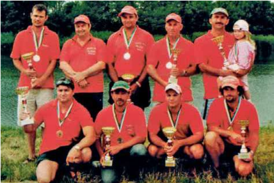
A Délpest-MAVER csapata

anyagiakat nem kímélő, áldozatos munkájának köszönhetően – utánpótlás nevelésére, és a női versenyzők támogatására is.