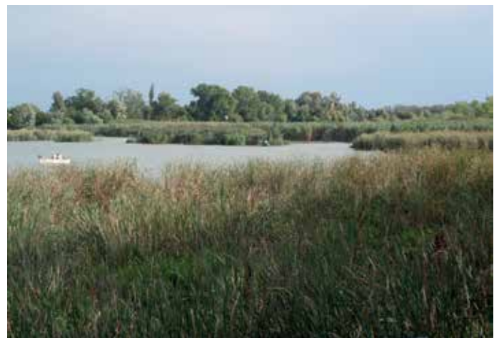
Kilátás a BSE horgásztanyáról

A környék történetének legjelentősebb eseménye az 1876 februárjában a Nagy-Dunán levonuló jeges árvíz volt. A Soroksári Duna-ág 1872 óta egy földnyelvel volt elzárva a mai Gubacsi hídnál, így a közvetlen áradás elkerülte az időközben elmoscsarasodó mellékágot. A Tökölnél felgyülemlő jégtorlasz visszaduzzasztotta a Duna vizét, ami átszakította a bal parti töltést, és szabályosan letarolta a Csepel-sziget közepét, megmentve ezzel a fővárost az 1838-as árvíz utáni újabb katasztró-