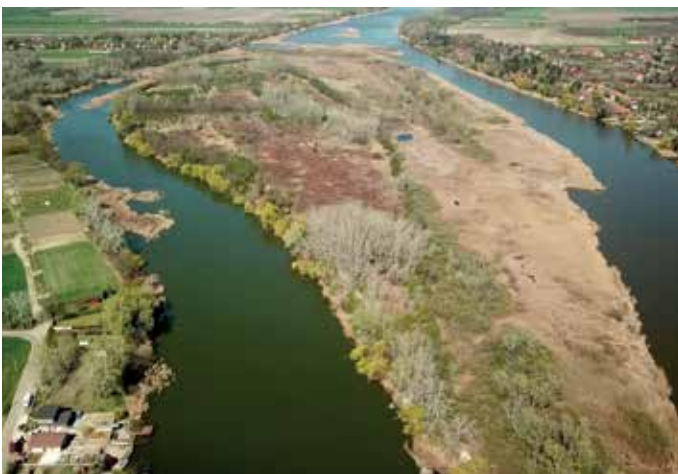
A Csupics-sziget madártávlatból