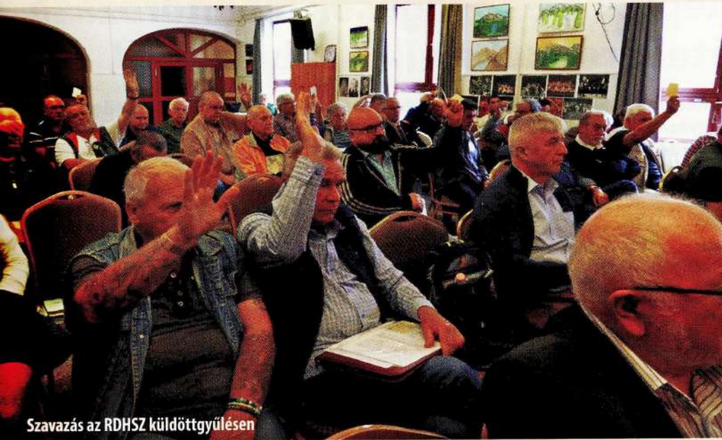
Szavazás az RDHSZ küldöttgyűlésen