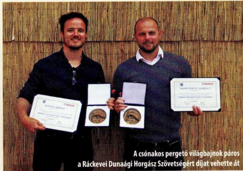
A csónakos pergető világbajnok páros a Ráckevei Dunaági Horgász Szövetségért díjat vehette át